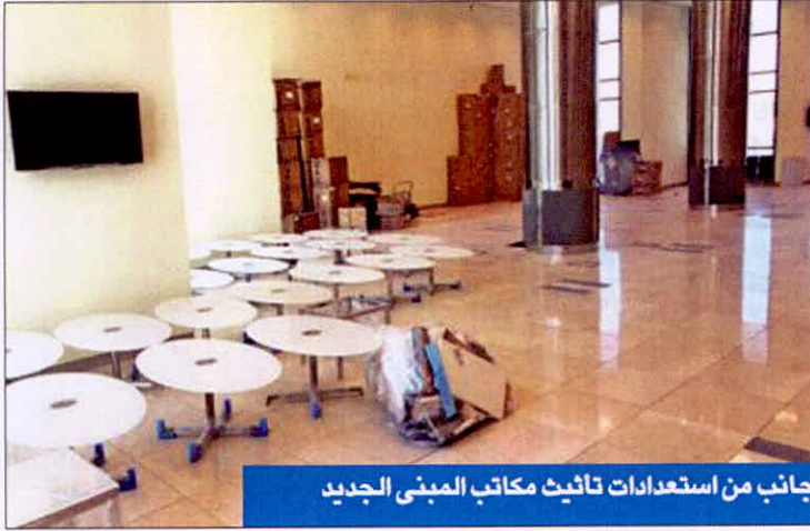
جانب من استعدادات تانيث مكاتب المبنى الجديد

باشرت اربع ادارات بالهيئة العامة للتعليم التطبيقي والتدريب عملها في ميناها الجديد بمنطقة الشويخ، وهي الشؤون الإدارية، والإدارة المالية، وقطاع التخطيط والتنمية، وإدارة السجل العام، لتكن باكورات انتقال اولى الادارات في ظل مباشرة موظفيها عملهم داخل المبنى الجديد.